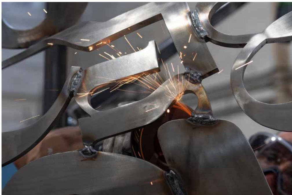
Design graphique : La bonne adresse - Impression : Despresse