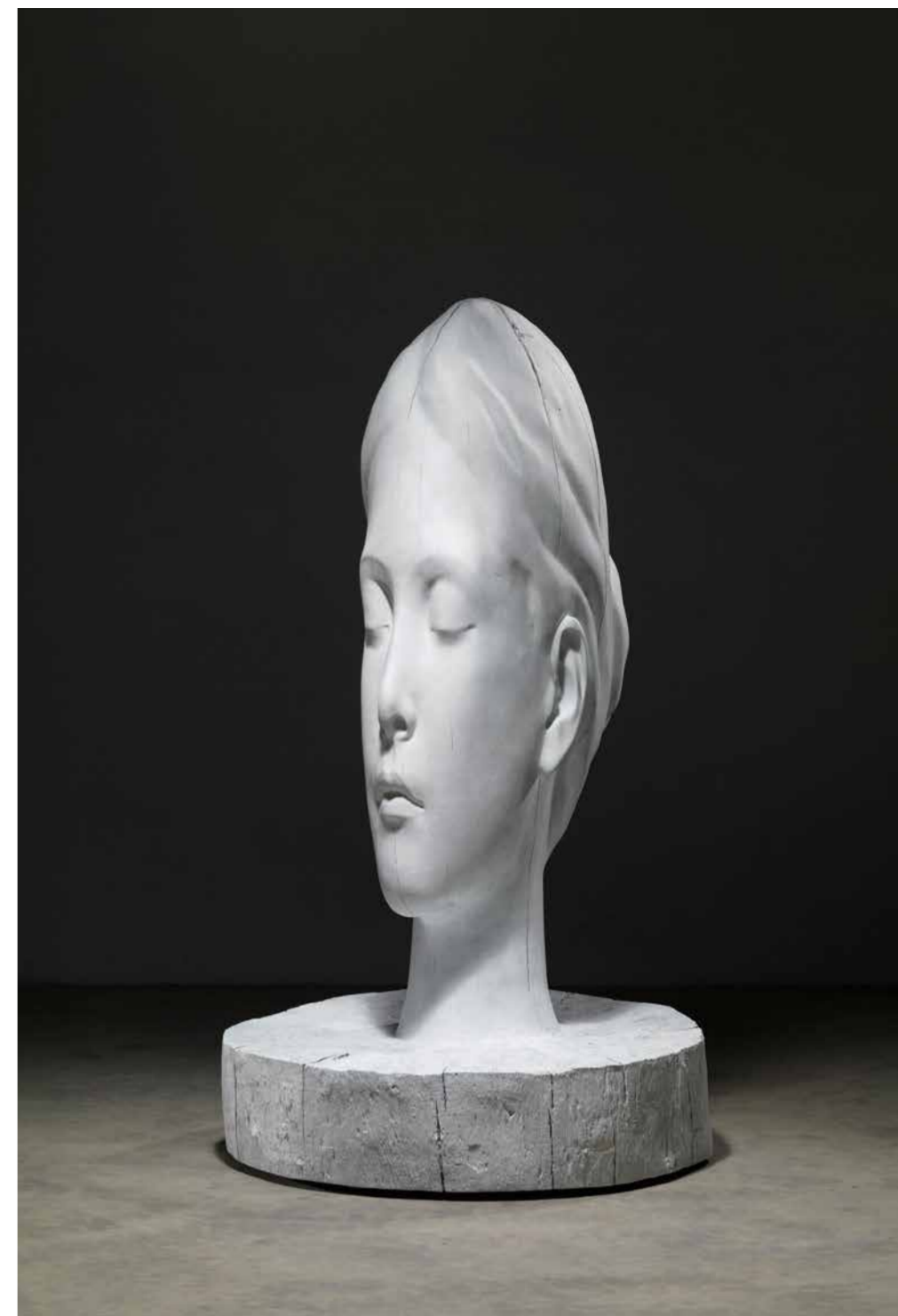
Jaume Plensa, White Forest (Laura) 2015, bronze, 196 x 103 x 103 cm © Plensa Studio Barcelona Photo Gasull Fotografia, © Adagp, Paris, 2024

Trente ans après la Biennale « Un sculpteur, une ville » qui, en 1994, voyait Jaume Plensa investir Valence, la Ville a souhaité de nouveau célébrer l'artiste et lui a commandé une œuvre pérenne pour l'espace public. Répondant avec amitié et fidélité, l'artiste livre une sculpture de plus de 4 mètres de haut réalisée en acier inoxydable. Composée à partir de différents alphabets du monde, elle participe d'une famille d'œuvres entrelaçant aléatoirement lettres et symboles, telle une dentelle de métal déployant le dessin d'une silhouette qui, en position assise, évoque un corps humain autant qu'une communauté universelle. La sculpture est installée place des Ormeaux, place historique de Valence située entre la cathédrale Saint-Apollinaire et le musée. Intitulée Le Messenger , elle se dresse parmi les arbres et la végétation plantés pour rafraîchir cet espace du centre-ville et viendra enrichir la collection d'œuvres d'art contemporain déjà présentes dans l'espace public valentinois. L'œuvre est inaugurée le 9 novembre 2024.