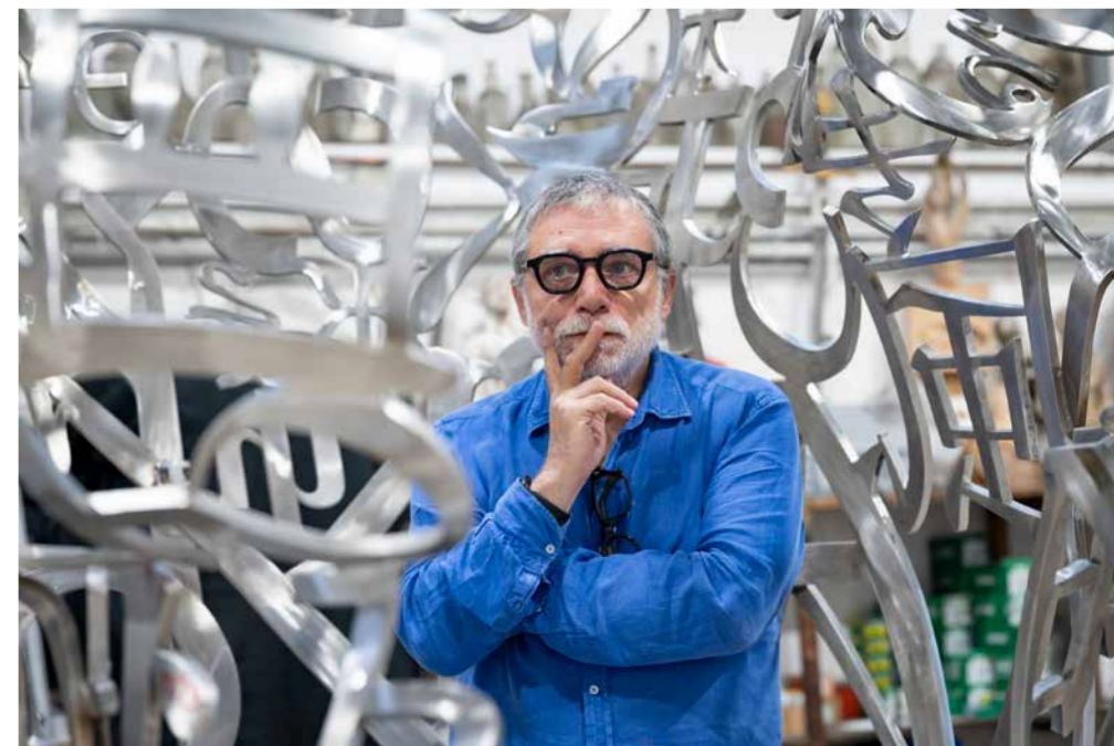
Jaume Plensa dans son atelier