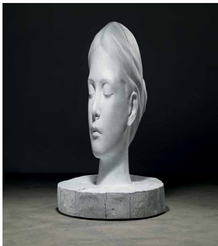
▲ Jaume Plensa, White Forest (Laura) , collection de l'artiste © Plensa Studio Barcelona, photo Gasull Fotografia © Adagp, Paris, 2024

Jaume Plensa est un artiste contemporain né à Barcelone en 1955. Il commence à exposer dès les années 1980 et se fait connaître par de grandes formes élémentaires en fonte d'acier.